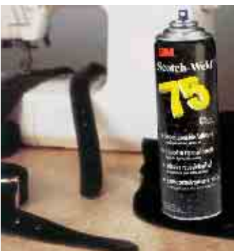
Přidržování emblémů a nášivek Sprejem 75 během přišívání