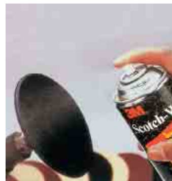
Přípevňování brusných disků Sprejem 77