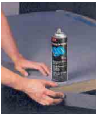
Lepení lišty na hranu pultu Sprejem 90