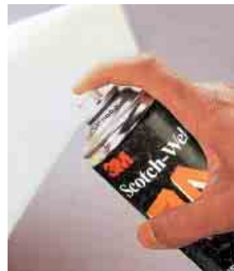
Použití Spreje 74 k lepení nábytkové pěny