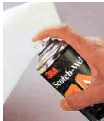
Použití Spreje 74 k lepení nábytkové pěny