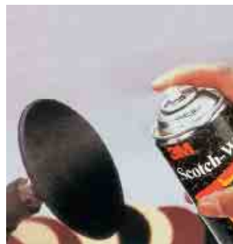
Přípevňování brusných disků Sprejem 77