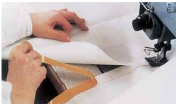
Oboustranná lepicí páska 3M přidržuje plachtovinu před jejím sešítím.

Oboustranné lepicí pásky 3M jsou ideální ke spojování materiálů před jejich sešíváním. Jedinečné složení lepidel 3M pásek odstranilo ulpívání lepidla na jehle a tím odpadly i nákladné prostoje při čištění strojů a nebezpečí poškozování zpracovávaných tkanin a materiálů. Typickými příklady použití jsou výroba plachet, upevňování tkaninových odznaků, praporů nebo transparentů a výroba propagačních oděvů.