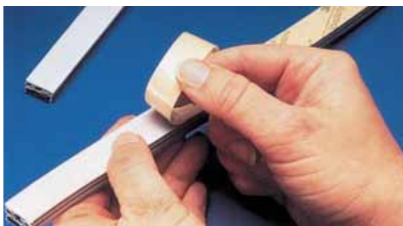
Laminování na díly pomocí velmi účinné oboustranné lepicí pásky.

Pokud vyrábíte produkty či polotovary, které jsou určeny k tomu, aby měly samolepicí vlastnosti, jako je tomu v případě některých typů těsnění, ozdobných částí nábytku, vytlačovaných plastů nebo též propagačních materiálů, pak Vám mohou oboustranné pásky od společnosti 3M poskytnout rychlé a účinné prostředky pro dosažení trvanlivého spoje. Nanesete pásku na daný produkt a na její horní straně ponecháte krycí vrstvu /liner/ až do okamžiku, kdy chcete předmět někam nalepit.