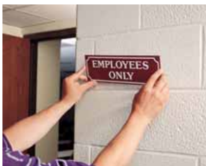
Lepení popisných tabulek (páska 9529, 9536)