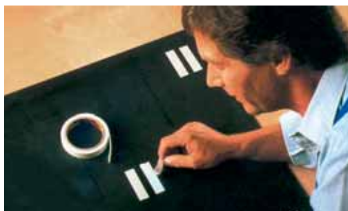
Lepení zrcadel (páska 4026)